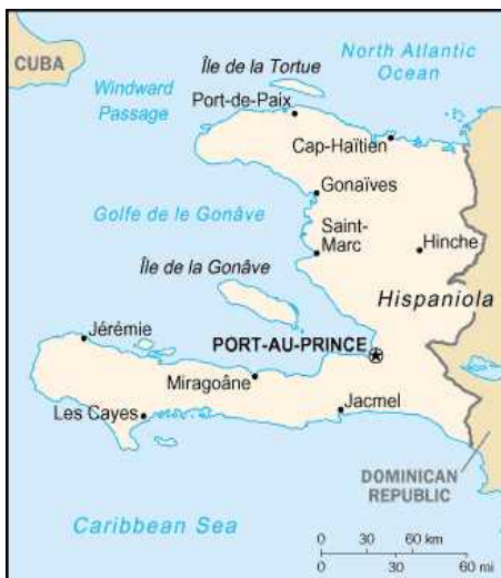
Map of Haiti/Mapa de Haiti