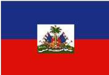
Haiti's Flag/Bandera de Haiti